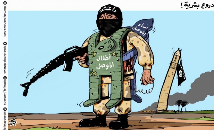
الشكل رقم 2: الدروع البشرية، عماد حجاج، 17 حزيران/ يونيو 2017

فيها داعش بإساءة معاملة النساء والأطفال، ما يسلط الضوء على عدم احترام داعش العميق للحياة البشرية، حتى بالنسبة لأولئك الذين يعتبرون أبرياء عادة.