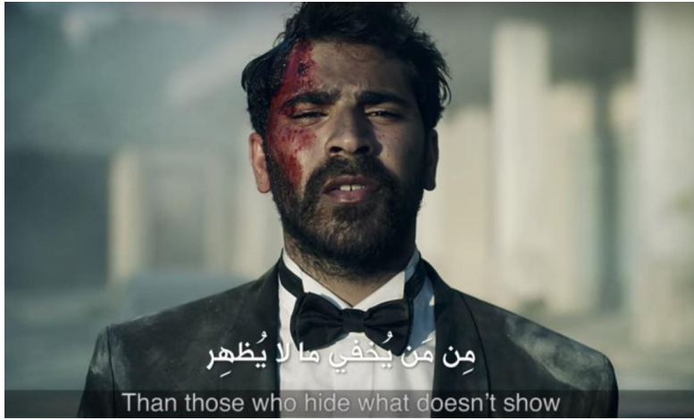
الشكل رقم 3: صورة من إعلان زين الرمضاني 2017

يقدم إعلان زين أمثلة مماثلة. يقول المتطرف "الله أكبر" ويأتي الرد: "من من يُخفي ما لا يُظهر"، في تلميح لكون المتطرفين منافقين. وحين يكرر هتاف آخر "الله أكبر"، فإن الرد -هذه المرة من تلميذة- هو "من من يحفظ لا يتكبر". 78 في تلميح لكون المتطرفين يتبعون أوامر من الأئمة غير المؤهلين دون دراسة وتدبر للقواعد الدينية. وحث الإعلان مرة أخرى الجمهور المستهدف للتفكير بشكل نقدي حول الخطاب الديني الذي يعبر عنه شخصيات مشكوك فيها وفي مصداقيتها.