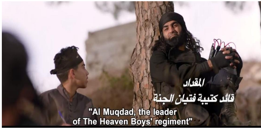
الشكل رقم 4: صورة من مسلسل غرابيب سود

تتمتع الأطر الإعلامية في المسلسل الدرامي بمزيد من المساحة مقارنة بالمنتجات الإعلامية الأقصر، وبالتالي مزيد من التوسع في طرح مواضيع مثل النفاق. يمكن القول أن هذه المواضيع كان ممكناً ربطها بتوصيات الحلول. فعلى سبيل المثال، يعرض مشهد في الحلقة الرابعة كيف تدعو المجموعة لأمر وتنفذ عكسه. يتوقف الأمير عن السير ويطلب من جنوده عدم السير على بيت نمل. في الوقت نفسه، فهم ذاهبون للصلاة في المسجد وسط أكوام لجثث بشرية قاموا هم بقتلها. وهذا يدل على عدم احترام واضح للقيم الإنسانية التي تحرم قدسية الحياة البشرية بغض النظر عن الدين. 83 ويسير المقداد، قائد "كتيبة فتیان الجنة" أيضاً إلى الصلاة على الفور بعد أن قام بنحر أحد 'فتيانه'. 84